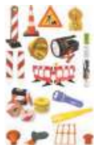
MATERIAL DE SEÑALIZACIÓN

También se consideran equipos de trabajo la ropa no inflamable y todo aquel material de señalización que se utilice para que nadie ajeno acceda al lugar de trabajo.