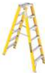
ESCALERA DE MATERIAL DIELECTRICO