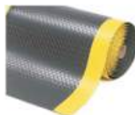
ALFOMBRA DE AISLAMIENTO DIELECTRICO