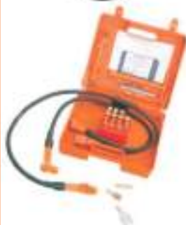
DISPOSITIVO DE PUESTA A TIERRA