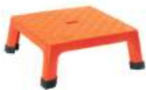
BANQUETA DE AISLAMIENTO DIELECTRICO