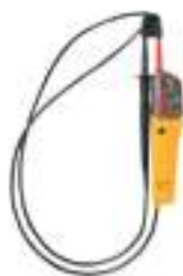
COMPROBADOR DE TENSIÓN